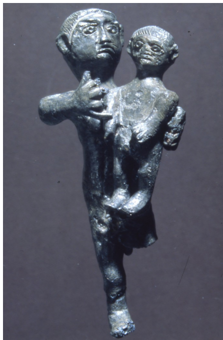
Statuetta di madre con bambino in lega di piombo e stagno (I secolo d.C.)

Si tratta, probabilmente, di ex voto legati al mondo femminile e alla fertilità. Si ipotizza, infatti, che nel santuario venissero adorate contemporaneamente più divinità, con preferenza per quelle femminili. Non va dimenticato inoltre che, entro il Pantheon romano, sono probabilmente confluite le antiche credenze indigene.