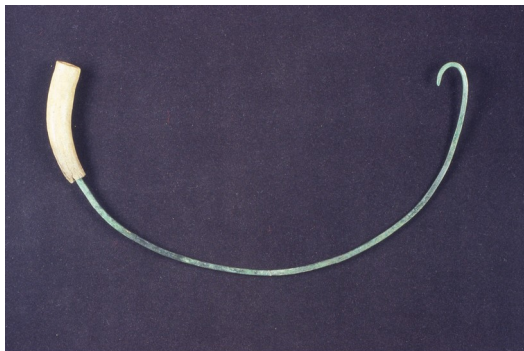
Chiave di bronzo con manico in osso

San Martino fanno uso di una lingua indigena e praticano, qui probabilmente, un tipo di culto legato ai cosiddetti roghi votivi ( Brandopferplätze ), diffusi in tutta l'area alpina centro-orientale a partire dal XIV secolo a.C.