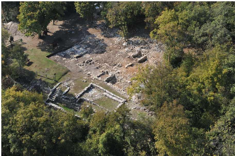
Resti del villaggio

A partire dal IV-V secolo, nella zona sud-orientale a valle del santuario furono realizzate numerose strutture abitative su terrazzamenti artificiali in parte di origine preromana.