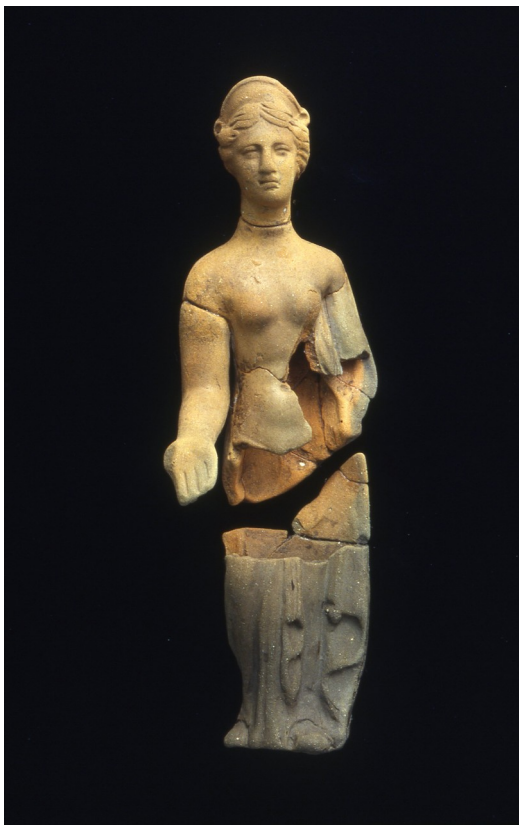
Statuetta di Afrodite pudica in terracotta (I secolo d.C.)

La funzione sacra del sito è dimostrata dal tipo di oggetti ritrovati nei crolli di alcuni ambienti (a sinistra della