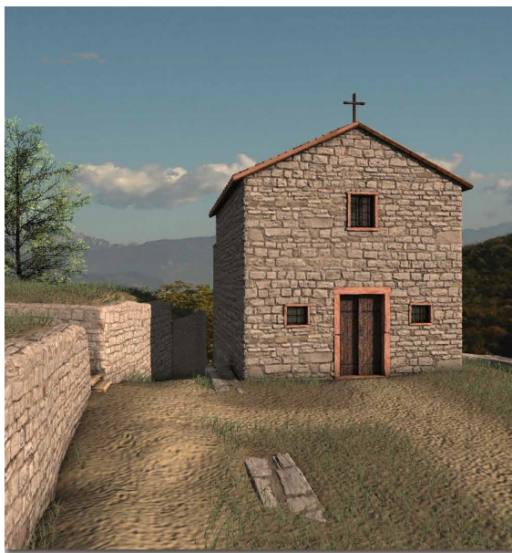
Ricostruzione virtuale della chiesa (studio tecnico L. Pugliese)

La chiesa si trova citata per la prima volta nel 1288 (... via per quam itur ad Sanctum Martinum... ) e poi, esplicitamente nominata “San Martino sul Monte”, nel 1481. Viene interdetta nel 1612 come ricorda, nel 1750, il resoconto di una delle visite che periodicamente effettuavano i delegati del vescovo (Atti Visitali): in questo stesso documento viene decretata la distruzione dell’edificio a causa delle sue pessime condizioni.