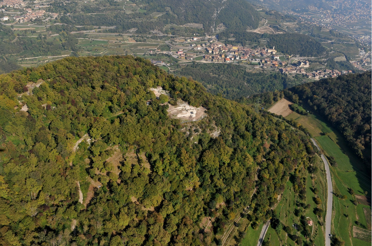
Il sito dall'alto