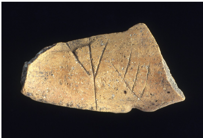
Frammento di recipiente in ceramica con segni alfabetiformi

Le tracce della presenza protostorica si trovano un po' ovunque nel sito e sono emerse di recente anche nella zona sud-est, con un edificio, al di sotto dell'abitato di IV-VI (VII?) secolo.