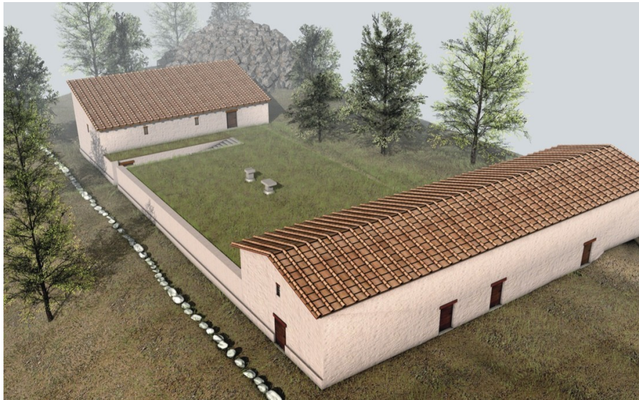
Ricostruzione virtuale del santuario (studio tecnico L. Pugliese)

I vani in muratura compongono una pianta grosso modo rettangolare, che circonda la zona più elevata, dove si ritiene fosse officiato il culto. In assenza di chiare tracce di strutture occorre immaginare che tale spazio sia